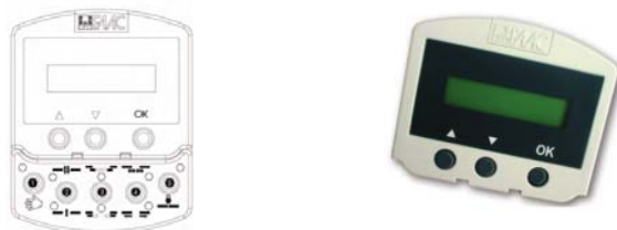
Extern te plaatsen keuzeschakelaar. (SD Keeper) met of zonder programmeerdisplay.

De elektronische besturing zorgt voor een intelligente controle. Een microprocessor gaat in real-time alle activiteiten van de deur na. Door middel van een extern te plaatsen functietoetsenbord (SD Keeper) kan de bedrijfslogica (automatisch, éénrichting, twee richtingen, gedeeltelijk open, geheel open, continue open, handbediening, nacht of slot) worden gekozen.